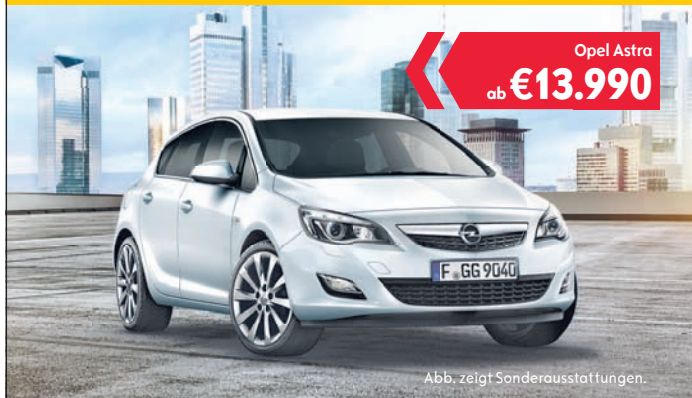
Abb. zeigt Sonderausstattungen.