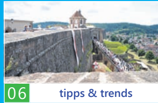
06 tipps & trends

Magazin für die Südwestpfalz August 2012 www.rwth-magazin.de