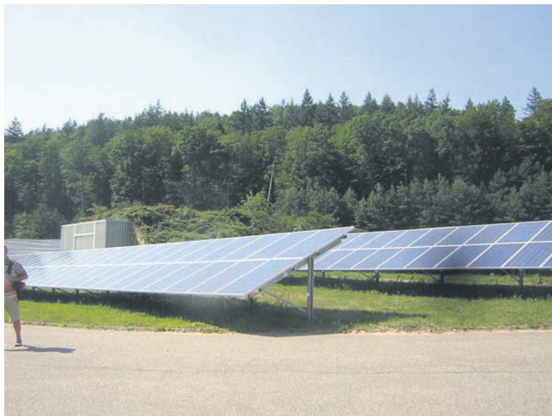
Die neue Solaranlage im ehemaligen Clauser US-Giftgaslager.