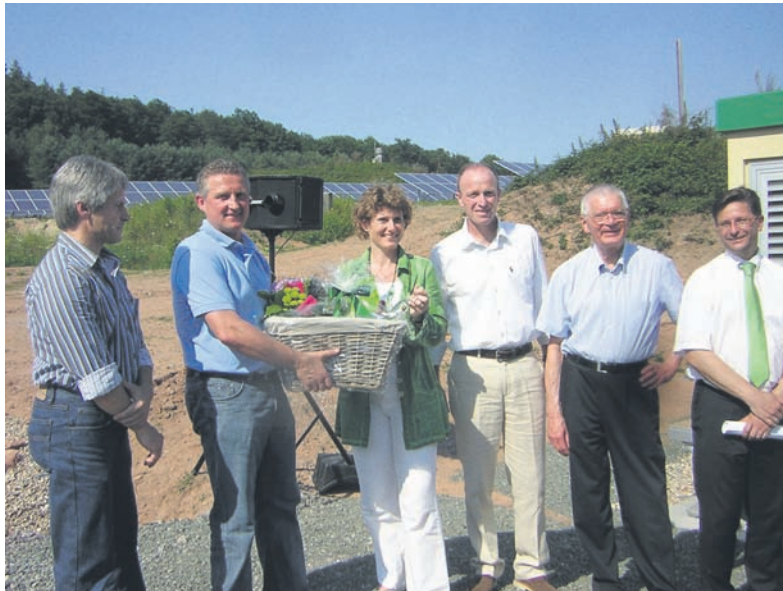
Die rheinland-pfälzische Wirtschafts- und Energieministerin, Eveline Lemke (Bildmitte) wurde von den zahlreichen Ortspolitikern herzlich begrüßt.

Clausen. Der auf dem ehemaligen US- Giftgaslager entstandene größte Solarpark im Landkreis Südwestpfalz, wurde von der rheinland- pfälzischen Wirtschafts- und Energieministerin, Eveline Lemke im Rahmen eines kleinen Bürgerfestes, bei über 30 Grad Sonne, offiziell eingeweiht. „Wo einst tödliche Giftgase lagerten, wird heute sauberer Solarstrom produziert, der ins Netz vor Ort eingespeist wird. So wird die Ortsgemeinde Stormexporteurin. Das ist genau das was wir uns wünschen, freute sich die Landesministerin und stellvertretende Ministerpräsidentin, über dieses gelungene Beispiel für Konversion. Der Solarpark Clausen sei das brandneue Beispiel der gelungenen Umnutzung einer ehemals militärischen Liegenschaft mithilfe der regenerativen Energien. Obwohl dies in Rheinland-Pfalz kein Einzelfall ist, freue ich mich