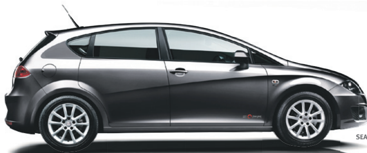
SEAT Leon Copa