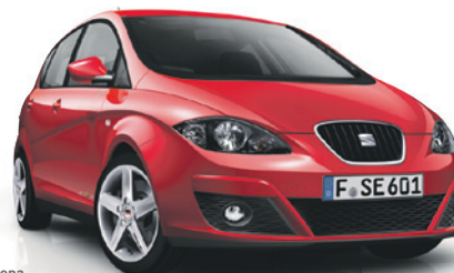
SEAT Altea Copa