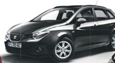
SEAT Ibiza ST Kombi Copa