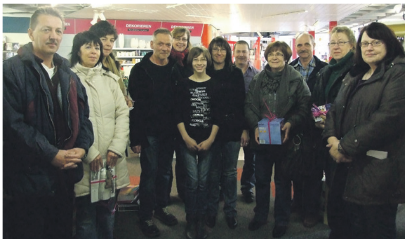
Die glücklichen Gewinner der „Fachmarkt-Pfundstein-Weihnachtsverlosung“ bei der Übergabe der Preise

Persönliche Informationen können sie in der Zeit der Hochzeitsausstellung Freitags zwischen 14 und 16 Uhr bei einem leckeren Drink erfahren. Kontakt info@cocktail.de oder 01736510474.