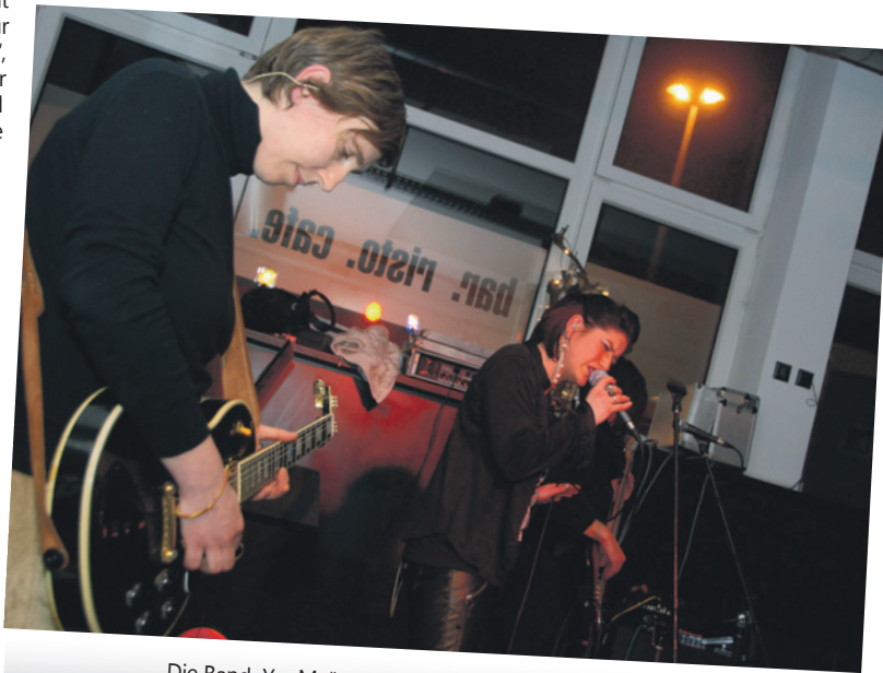
Die Band „Yes Ma’am“ aus Landau auf der Parkplatz-Bühne.

Immer wieder Neues ausprobieren und dabei das Bewährte nicht vergessen. So wird es auch im ganzen Jahr 2011 weitergehen, versichern die beiden Peters hinter der Parkplatztkeke, Peter Stumpf und Peter Dreher. Text und Foto: SF