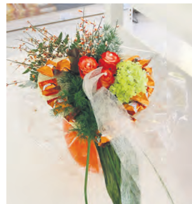
„Süße Blumengrüße“ mit Raffaello oder Ferrero-Küsschen erhalten Sie bei der „Blumenstube Schütz“ Fritz-Claus-Ring 3 in Rodalben. Um Vorbestellung wird gebeten. Tel. 06331/18338.