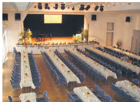
Für größere Gesellschaften (bis zu 450 Personen) bietet sich der große Saal des „Bürgerhaus Schuhfabrik“ in Waldfischbach-Burgalben für Ihre Festlichkeiten an.

spezialisierten Hochzeitsplanern in Anspruch nehmen. Denn für Braut und Bräutigam darf doch „ihr“ Tag nicht von Hektik und Sorgen um alles geprägt sein. Entspannt und gut aussehend am Ende der großen Tafel vorsitzen und den perfekten Gastgeber zu geben, ist an diesem Festtag Arbeit genug.