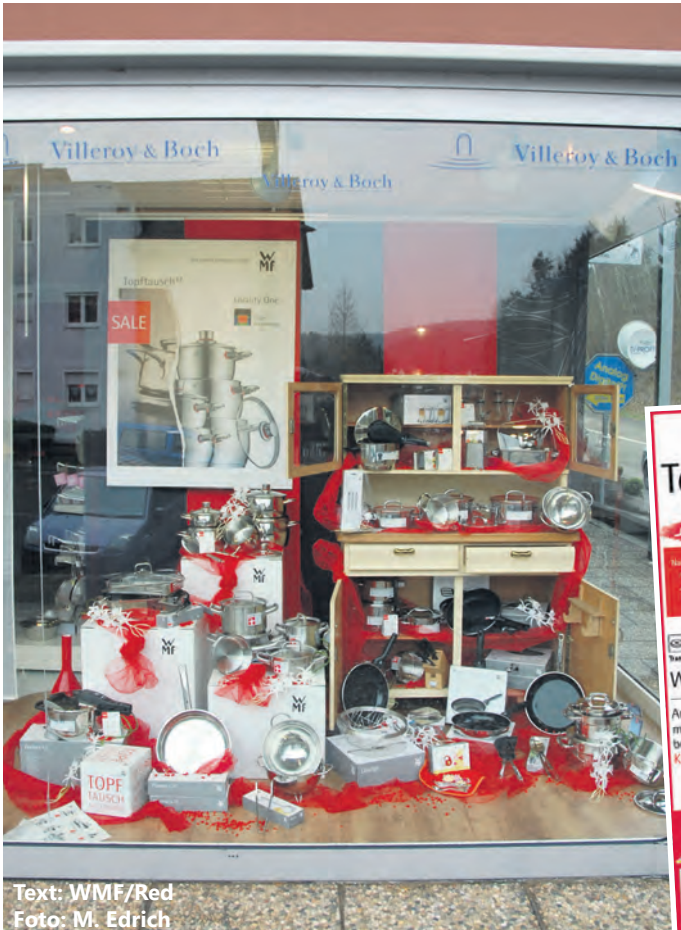
Text: WMF/Red

Ein gutes Geschäft schmeckt immer: Tauschen Sie alt gegen neu.