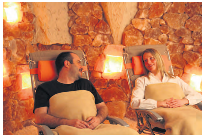
Einfach mal zu zweit in der Salzgrotte entspannen. Geschenkgutscheine erhalten Sie in der Salzgrotte Rodalben, Hauptstr. 147, Tel. 06331-5083711