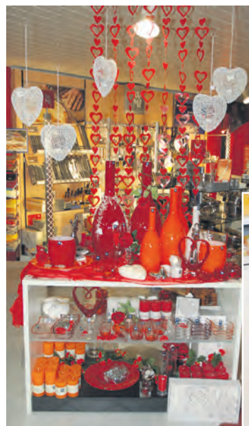
Im Fachmarkt Pfundstein erwarten Sie die neuen Kollektionen von Leonardo. Beispielsweise die neuen Vasen in den Trendfarben orange und rot.