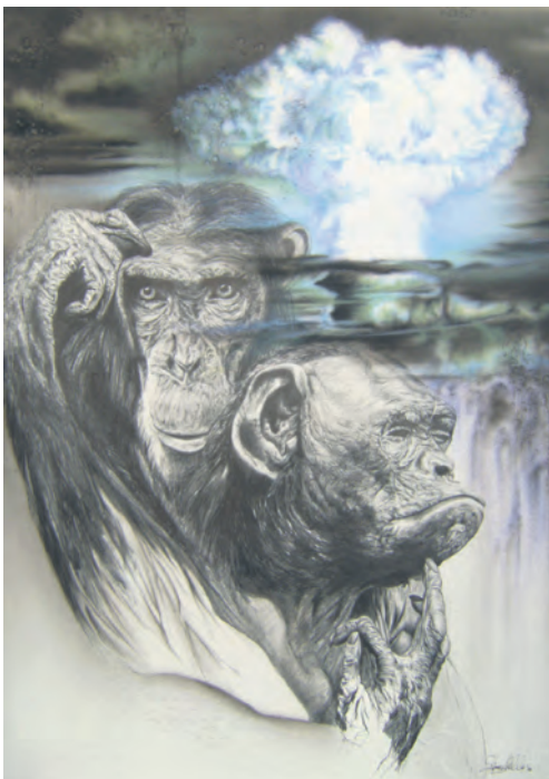
Bildtitel: „Lasst uns erst mal nachdenken“ Grafit, Acryl, Karton 2010