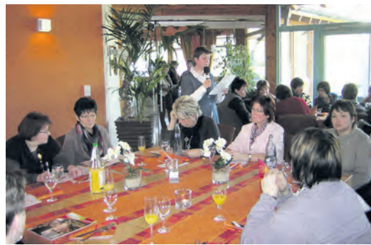
Das traditionelle Neujahrstreffen des Landfrauenkreisverbandes Pirmasens-Zweibrücken im Golfrestaurant Hitscherhof bei Rieschweiler-Mühlbach fand erneut großen Zuspruch.