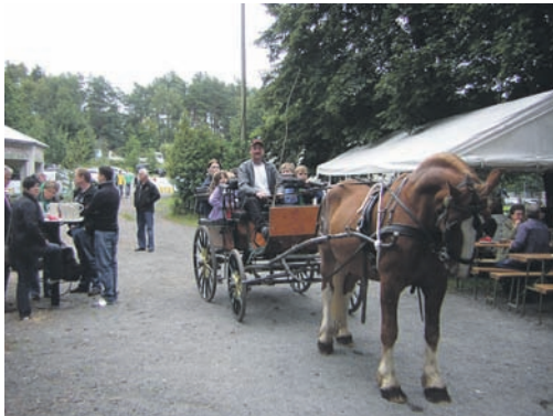
Die Kinder können auch in diesem Jahr wieder kostenlos mit der Pferdekutsche fahren

Das vom Förderkreis des Turn- und Sportvereins (TuS) organisierte 32. „Wissefescht“, startet am Samstag, 28. Juli, um 16 Uhr auf dem Gartengelände am Sportheim mit dem Fissanstich durch Verbandsbürgermeister Werner Becker. Eine vielseitige Auswahl an lukullischen Speisen und Getränken lockt die Besucher sicherlich wieder in Scharen an den großen Pavillon inmitten des Festplatzes.