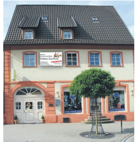
Neben ihrer Praxis in Rodalben, Hauptstr. 118, betreiben die Zachraus seit kurzem auch eine Praxis in Pirmasens, Bahnhofstr. 2-6 (ehemals Sport Stuppy).