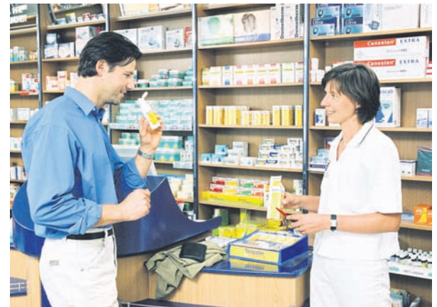
Vor dem Kauf rezeptfreier Medikamente sollte man sich beraten lassen

Zu komplex die Materie rund um Medikamente und deren Wirkstoffe, als dass sie von Otto Normalverbraucher beherrscht werden könnte. Aus Verantwortung dem eigenen Körper gegenüber sollten man auf die Beratung durch das Fachpersonal