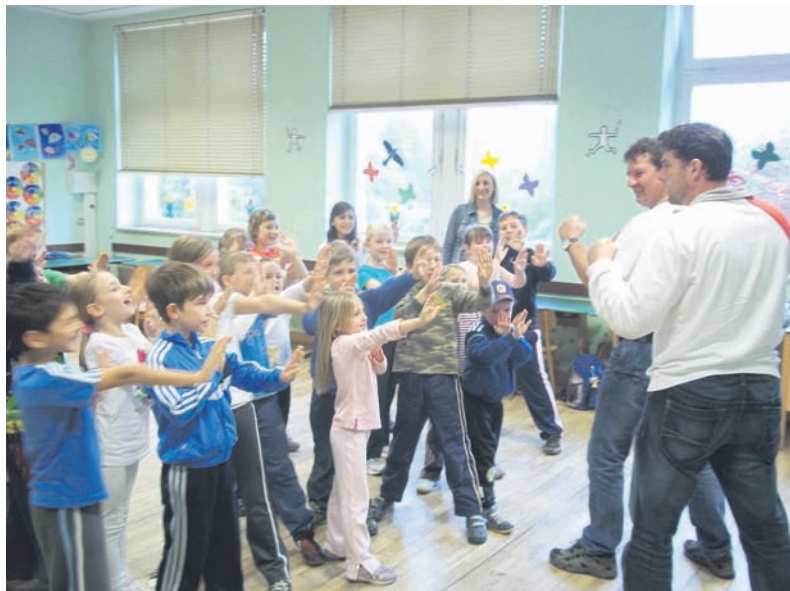
Das Thema Gewaltprävention stieß bei den Schulkindern auf reges Interesse