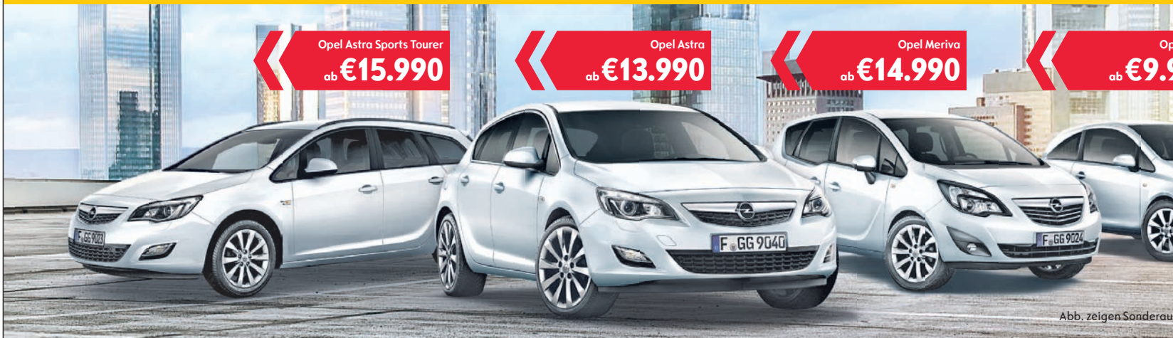
Abb. zeigen Sonderausstattung