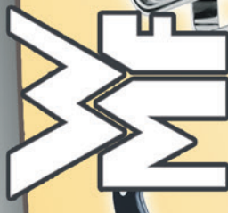
WMF Kochmesser „Spitzenklasse Plus“ Klingenlänge 20 cm Statt € 74,95 - jetzt