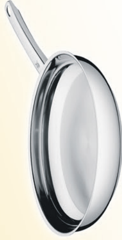
WMF Pfanne Ø 28 cm