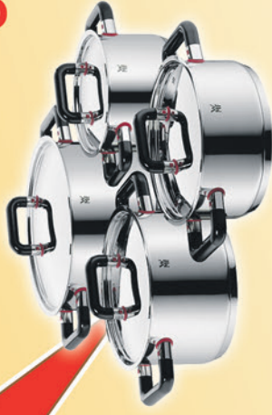
WMF Kochgeschirrsatz „Comfort One“ 4 tlg. Bratentopf mit Deckel Ø 20 cm Fleischtopf mit Deckel Ø 16, 20 und 24 cm Chrommangan-Edelstahl Rostfrei 18/10 TransTherm-Allherdboden