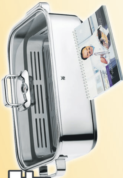
WMF Aroma-Dampfgarer „Vitalis“ Incl. kostenlosem Kochbuch