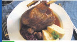
06 tipps & trends

Magazin für die Südwestpfalz November 2012 www.rwt-magazin.de