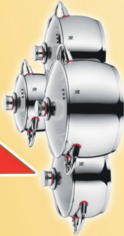
WMF Kochgeschirrsatz „Quality One“ 4 tlg. Bratentopf mit Deckel Ø 20 cm Fleischtopf mit Deckel Ø 16, 20 und 24 cm Chrommangan-Edelstahl Rostfrei 18/10 TransTherm-Allherdboden