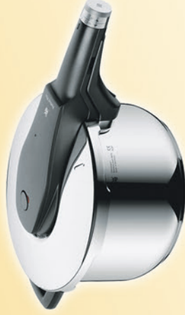
WMF Schnellkochtopf „Perfect Pro“ 4,5 l Mit kostenlosem Dichttring