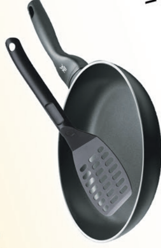
WMF Pfanne Ø 28 cm