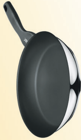
WMF Pfanne Ø 28 cm