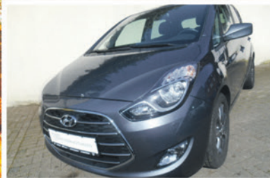
Hyundai ix20 1.4 blue Passion

EZ: 04/2016 KM: 44.430 KW / PS: 66 / 90 TÜV / AU: NEU Ausstattung: Klimaanlage, Sitzheizung, Radio-MP3, ZV mit Fernbedienung, u.v.m.