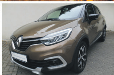
Renault Captur TCe 90 Intens

EZ: 09/2017 KM: 50.700 KW / PS: 66 / 90 TÜV / AU: NEU Ausstattung: Klimaautomatik, Sitzheizung, Navigationssystem, Parksensoren hinten, u.v.m.