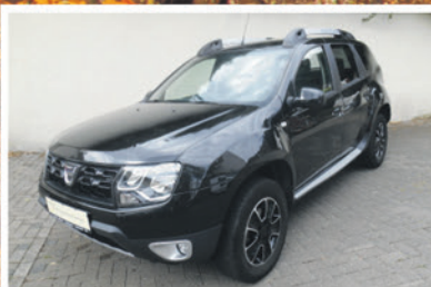
Dacia Duster dCi 110 FAP 4x2 EDC Blackshadow

EZ: 12/2017 KM: 32.700 KW / PS: 80 / 109 TÜV / AU: NEU Ausstattung: Klimaanlage, Sitzheizung, Navigationssystem, Ledersitze, Parksensoren & Rückfahrkamera, u.v.m.