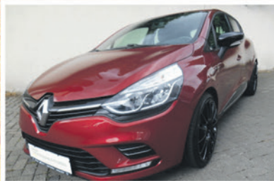
Renault Clio 1.2 16V 75 Limited Extrem

EZ: 08/2017 KM: 19.900 KW / PS: 54 / 73 TÜV / AU: NEU Ausstattung: Klimaanlage, Bluetooth, Navigationssystem, LED-Tagfahrlicht, u.v.m.