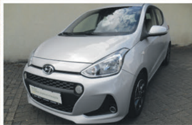
Hyundai i10 1.2 YES!

EZ: 08/2017 KM: 39.350 KW / PS: 64 / 87 TÜV / AU: NEU Ausstattung: Klimaanlage, Sitzheizung, beheizbares Lenkrad, Zentralverriegelung, elektr. Fensterheber, u.v.m.