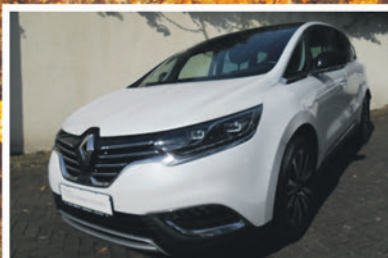
Renault Espace dCi160 EDC Initiale Paris

EZ: 12/2015 KM: 61.700 KW / PS: 118 / 160 TÜV / AU: NEU Ausstattung: Klimaautomatik, Sitzheizung vorne & hinten, Navigationssystem, Parksensoren & Kamera, u.v.m.