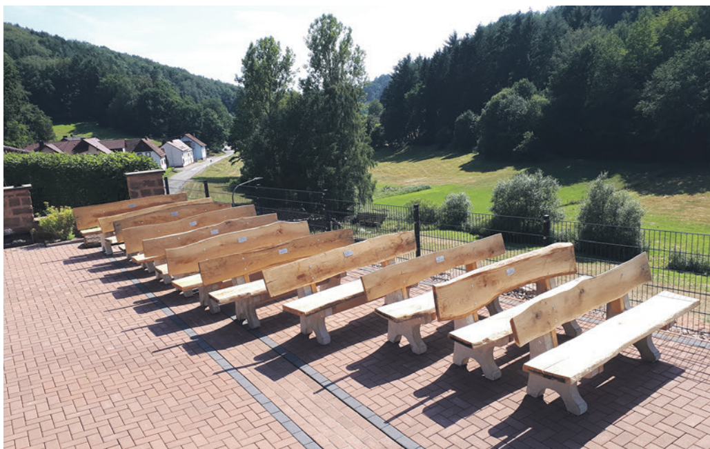
Die Forstbetriebsgemeinschaft Sickingen Höhe stiftete verschiedenen Ortsgemeinden Sitzbänke zum Aufstellen in der Natur.

ME mathiasedrich.de rwt magazin • pc • web • print