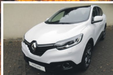
Renault Kadjar TCe 130 EDC Collection

EZ: 05/2018 KM: 20.600 KW / PS: 96 / 131 TÜV / AU: NEU Ausstattung: Klimaautomatik, Sitzheizung, Rückfahrkamera, Licht- / Regensensor, u.v.m..