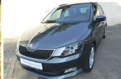
Skoda Fabia Combi 1.0 TSI Drive

EZ: 09/2017 KM: 40.200 KW / PS: 70 / 95 TÜV / AU: NEU Ausstattung: Klimaautomatik, Sitzheizung, Parksensoren vorne und hinten, Bluetooth, u.v.m.