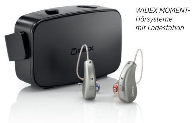
WIDEX MOMENT- Hörsysteme mit Ladestation

Diese Leistungen sind für Sie kostenfrei und unverbindlich.