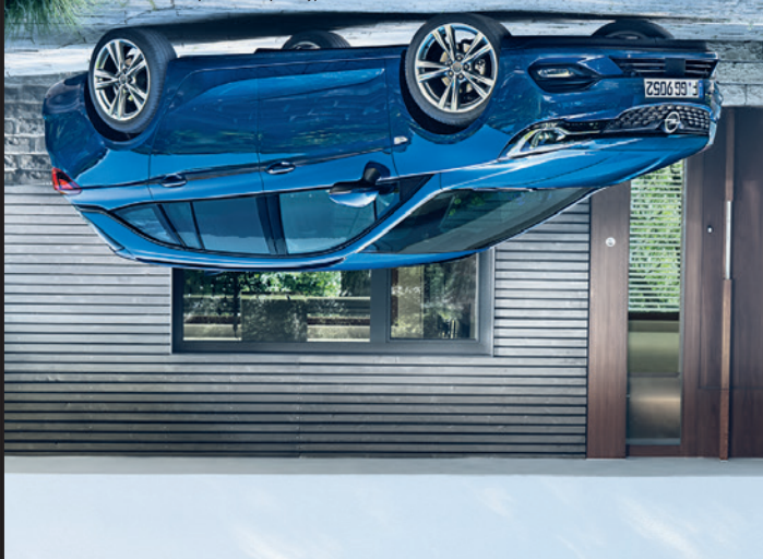
Beispielfoto der Baureihe. Ausstattungsmerkmale ggf. nicht Bestandteil des Angebots.