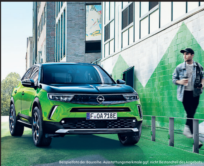
Beispielfoto der Baureihe. Ausstattungsmerkmale ggf. nicht Bestandteil des Angebots.